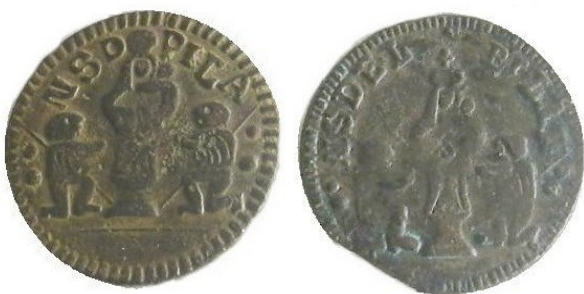
Figura 9. Tipos H19 y H20b.

Diseño en forma de "LIRA", tipos H14 a H16; con fuerte engrosamiento a la altura de los hombros; la túnica cubre cabeza y brazos; hueco muy visible en el pecho entre los hombros, niño muy pequeño a la derecha. La corona es globular. Pilar representado por dos losas separadas.