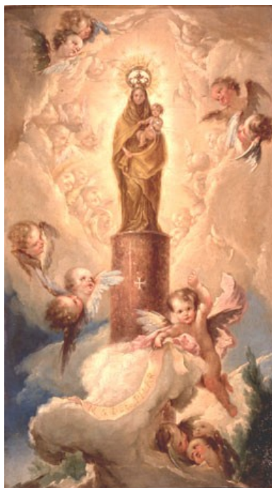
Figura 4. Pintura de Bayeu (datada en 1780) probable antecedente de los diseños "Ahusados" (figura 10). Museo de la Fundación Lázaro Galdiano.

Revisados los aspectos anteriores, es posible proponer para estos botones una datación centrada en el siglo XIX, y con mayor probabilidad entre ca. 1820 y ca. 1890. Excepto los directamente fechados, el resto pudo fabricarse en cualquier momento a lo largo de ese periodo; sin embargo los de tipo "ancho" 4 son probablemente de ca.1820-ca1850; mientras que los de figura "ondulada" podrían ser posteriores de 1840-1890, siendo los que presentan marca C/M de la primera mitad de ese periodo y el resto de la segunda.