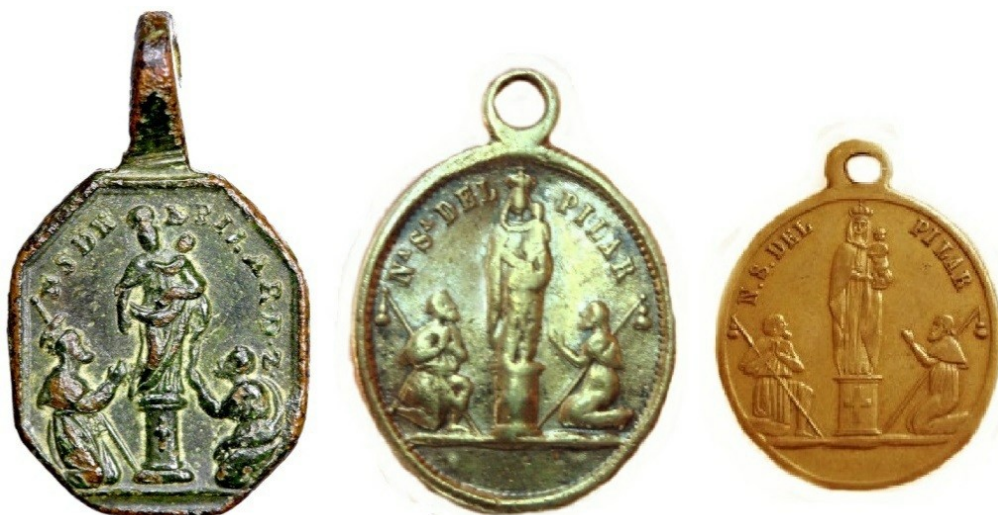
Figura 3. Medallas (siglo XVIII la primera y XIX la segunda y tercera) con representación similar a la utilizada en estos botones.

Son posibles antecedentes o, al menos, se aprecia una clara coincidencia de estilos y diseño, algunas medallas del siglo XVIII y XIX (Figura 3). También pinturas del XVIII-XIX pudieron servir de modelo, como el cuadro del pintor Ramón Bayeu (figura 4).