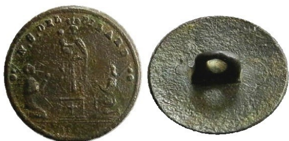
Figura 5. Tipos: H1, arriba y abajo izquierda; H52, abajo derecha.

Descripción de diseños básicos de esta Serie: