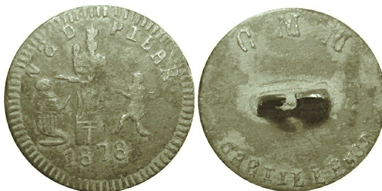
Figura 1. Botón tipo H11, datado en 1878 y fabricado por C.M.M. en Villanueva de los Castillejos.

Artículo originalmente publicado en revista D&M, Nº 48, mayo/junio 2015