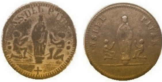
Figura 10. Tipos H21.3a y H21.2

Figura " AHUSADA ", tipo H21, muy estilizada con el niño muy pequeño a la derecha. Corona lenticular muy pequeña. Se conocen numerosas piezas con pasador de muletilla.