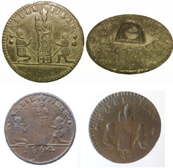
Figura 7. Tipos: H4.1a, arriba; H10.1 y H4.3a, abajo, izquierda y derecha.

Figura "ONDULADA", tipos H4 a H13, H202 y H203, se representan los pliegues de la ropa mediante líneas onduladas; la silueta, a su vez, también resulta ligeramente ondulada. Niño a la izquierda, la corona es de cuatro arcos o diademas redondeadas (visibles dos). Algunos subtipos con la marca en el reverso C/M. Es el diseño más abundante y con mayor número de subtipos y variantes.