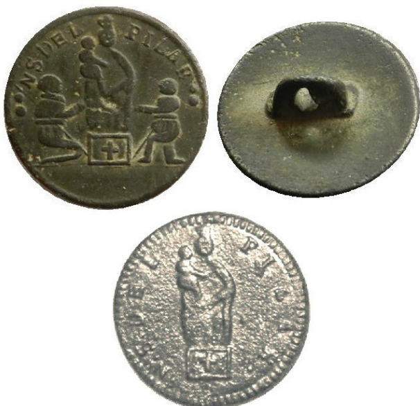
Figura 6. Tipos: H2, arriba y H3, abajo.

Diseño " DETALLADO ", tipos H1 y H201, es el de mejor arte, similar al de algunas medallas del XVIII-XIX; se representan claramente los pliegues del manto, también otros detalles (como la melena, ropas de los orantes, el pilar o el suelo), el niño va a la izquierda; y la corona es aparentemente abierta con cuatro picos (tres visibles).