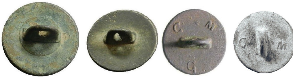
Figura 2. (De izda. a dcha.) Asa base circular, asa calzada; marcas C M G y C/M

La distribución de este tipo de botón no se circunscribe a la zona de Zaragoza, sino que es general por todo el territorio nacional. No se han hallado, de momento, referencias escritas que den razón de las fábricas o talleres donde se fundieron, pero las marcas de fabricante documentadas (C/M, C•M•G• y C.M.M. CASTILLEJOS) apuntan todas a Villanueva de los Castillejos en la provincia de Huelva. Las iniciales (ver figura 2) C/M son la marca correspondiente (al menos durante los años 40-50 del siglo XIX) a Cayetano Márquez, botonero de esta localidad; respecto a C•M•G• , aunque sólo se puede afirmar una coincidencia de iniciales podría tratarse del mismo botonero (o de sus herederos) que en fuentes escritas está documentado con nombre y apellidos completos: Cayetano Márquez García 2 . Y claramente se trata de esa localidad en el tercer caso (ya que incluye su denominación: Castillejos). Hay que considerar que los numerosos botoneros de Villanueva de los Castillejos distribuyeron sus productos entre vendedores ambulantes y hojalateros que repartían al por menor sus artículos por toda Andalucía y resto de España. Este hecho apoya la idea del carácter -no local- del uso de este tipo de botón, porque los botoneros de Villanueva de los Castillejos, lógicamente, debieron producir artículos del gusto general en toda España, para poder venderlos en cualquier lugar. Lo anterior no impide su posible fabricación en otras localidades.