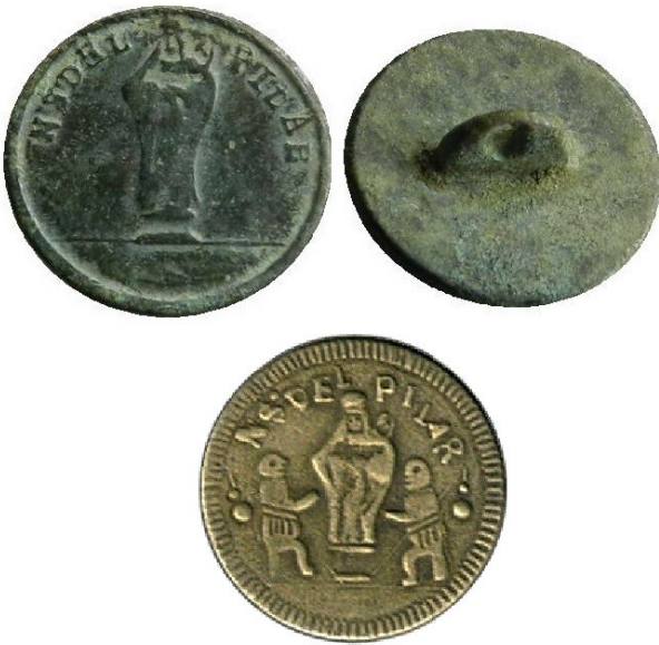
Figura 8. Tipos: arriba H16, abajo H14b.

Figura "ONDULADA", tipos H4 a H13, H202 y H203, se representan los pliegues de la ropa mediante líneas onduladas; la silueta, a su vez, también resulta ligeramente ondulada. Niño a la izquierda, la corona es de cuatro arcos o diademas redondeadas (visibles dos). Algunos subtipos con la marca en el reverso C/M. Es el diseño más abundante y con mayor número de subtipos y variantes.